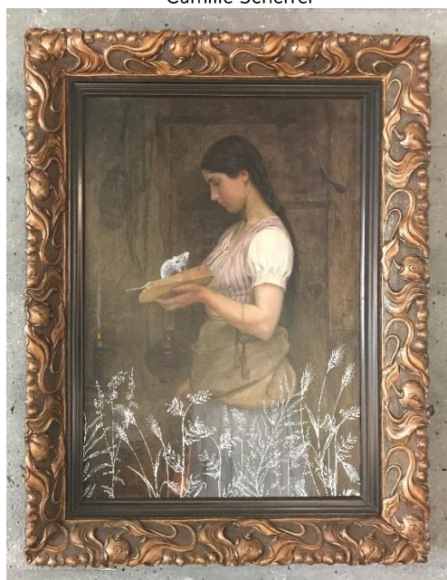
Extrait du nouveau mapping réalisé par Camille Scherrer sur le tableau Les Dix Heures de Frédéric Rouge © Camille Scherrer

Contacts : camille@chipchip.ch , 079 286 33 08 / www.chipchip.ch