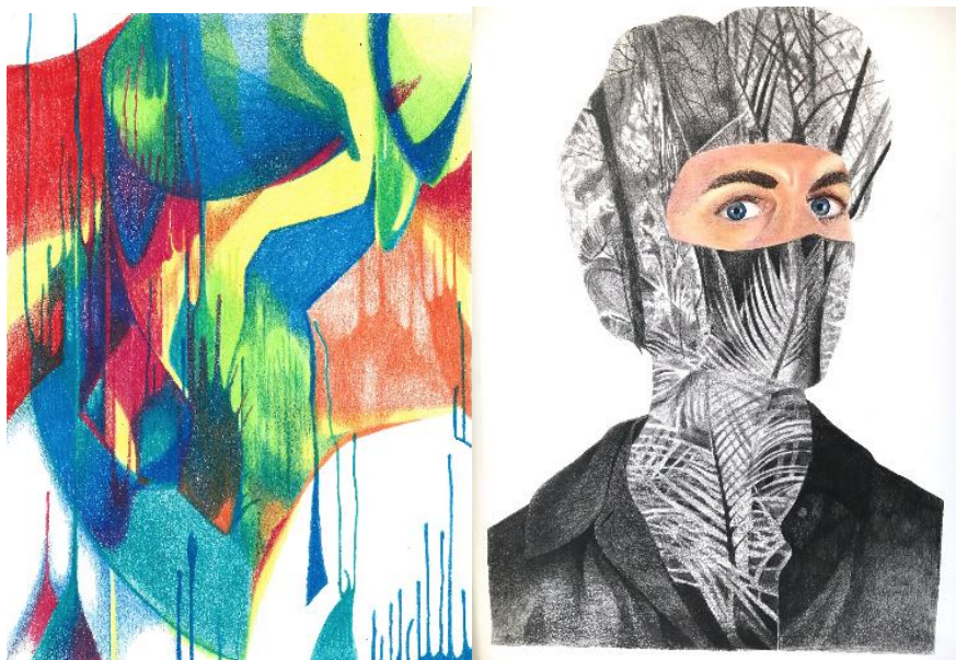
Barbara Cardinale, Sans titre V , crayons de couleur sur papier, 2022. © Barbara Cardinale Barbara Cardinale, Portrait Jungle , transfert et fusain sur papier, 2021. © Barbara Cardinale