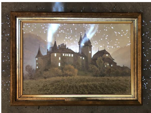
Mapping réalisé par Camille Scherrer sur Le Château d'Aigle de Frédéric Rouge pour l'Espace Graffenried © Camille Scherrer