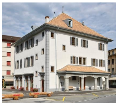
Ancienne Maison de Ville, Place du Marché, Aigle (vers 1885 et 2018)