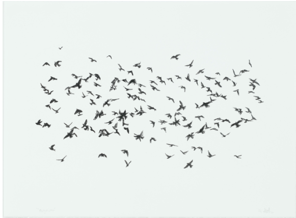
Joëlle Allet, Augurium , 2020

nuée. Augurium renvoie ainsi tant aux dilemmes et choix constants des êtres vivants face à la vie, qu'aux réactions de la société face à une crise. Réalisées lors du premier semi-confinement, ces estampes étaient un moyen pour l'artiste plasticienne de s'évader face à ces réactions de groupes. Elles prennent ainsi un tout autre sens. La liberté de l'individu s'oppose alors au pouvoir du groupe, aux mouvements qu'il entraîne et à la force qu'il crée. Si l'être humain isolé risque sa vie pour atteindre son rêve et prendre part à l'essaim, la société en groupe, elle, se confine pour protéger sa vie, au point d'en perdre l'essence même : sa liberté. Où s'arrête donc l'individu, la liberté et où commence la collectivité et la force ? : tant de questions et réflexions que Joëlle Allet nous invite à explorer ici.