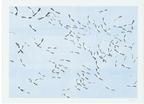
Joëlle Allet, Vol des cigognes , 2020