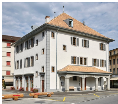
Ancienne Maison de Ville, Place du Marché, Aigle (vers 1885 et 2018)